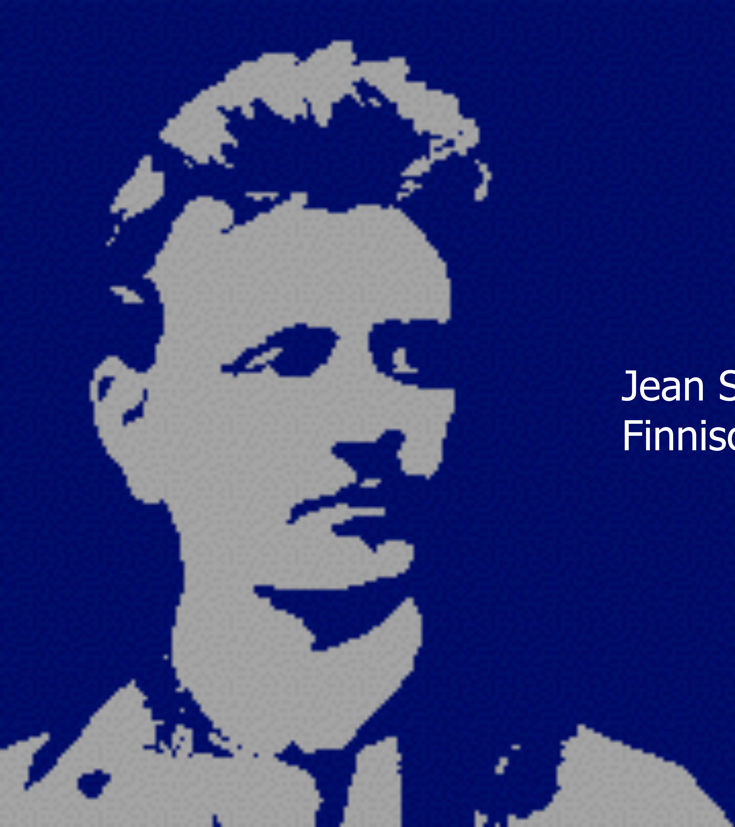
Jean Sibelius, Freimaurer Finnischer Komponist