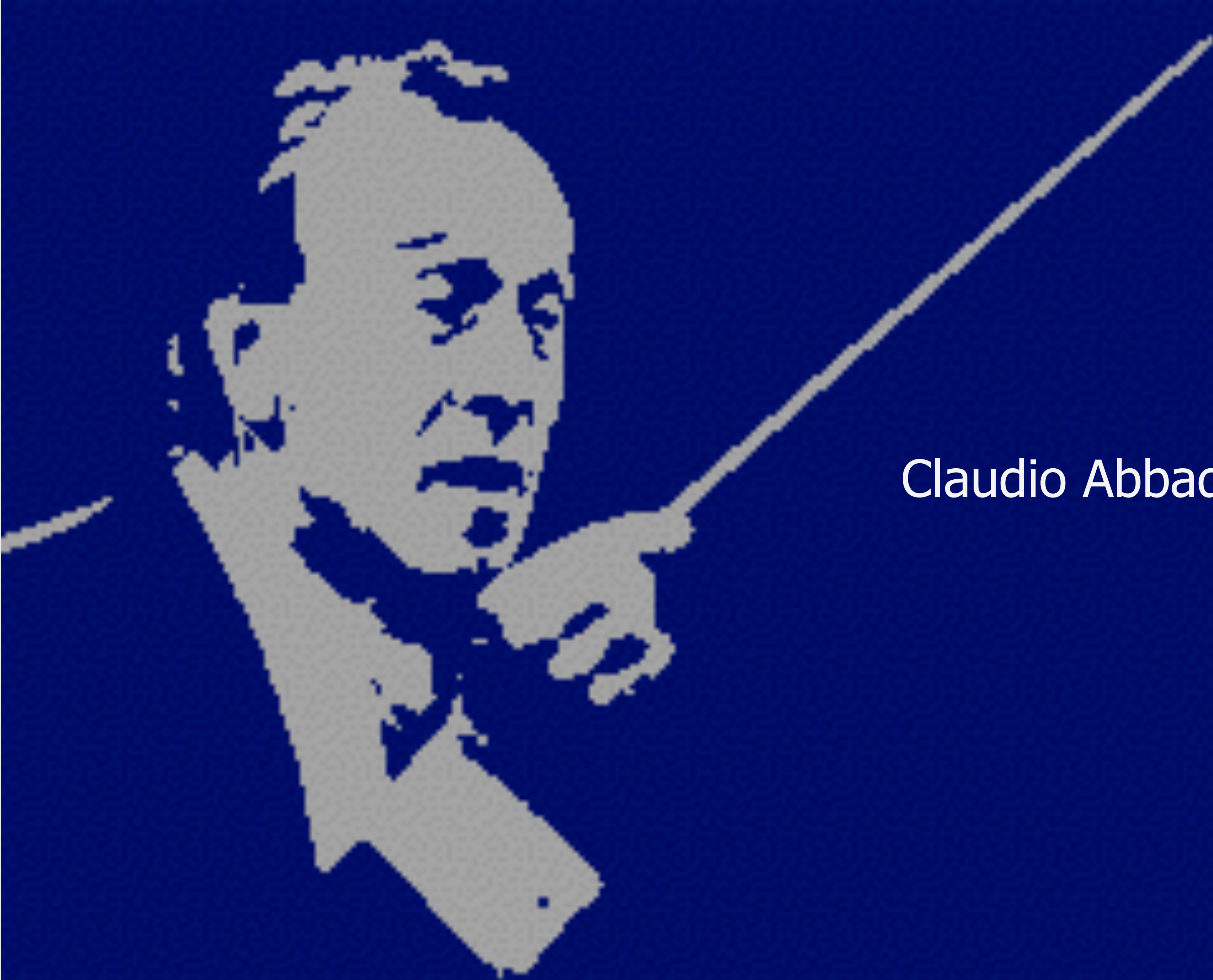
Claudio Abbado, Freimaurer