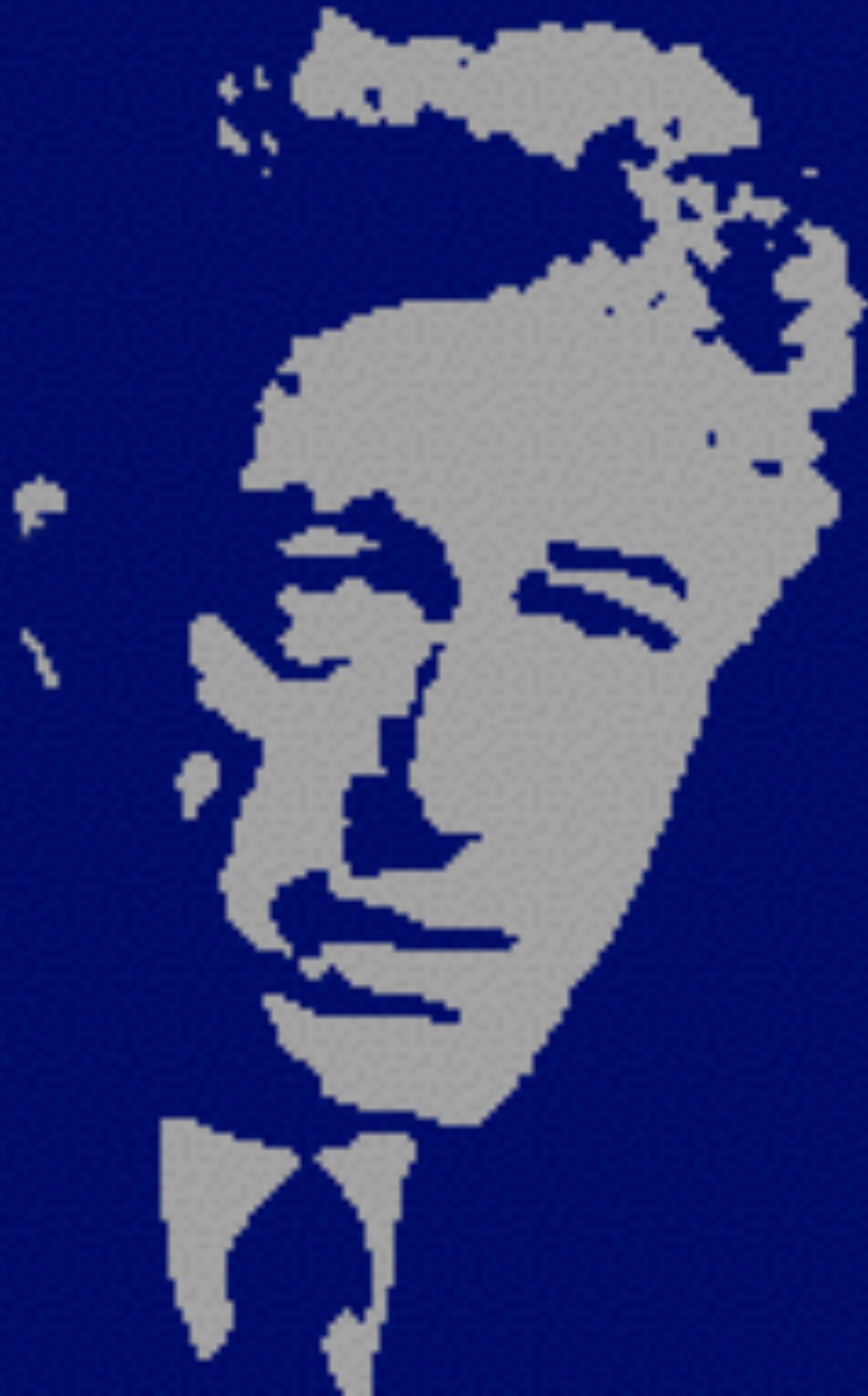
Alberto Giacometti, Freimaurer Schweizer Bildhauer und Kunstmaler